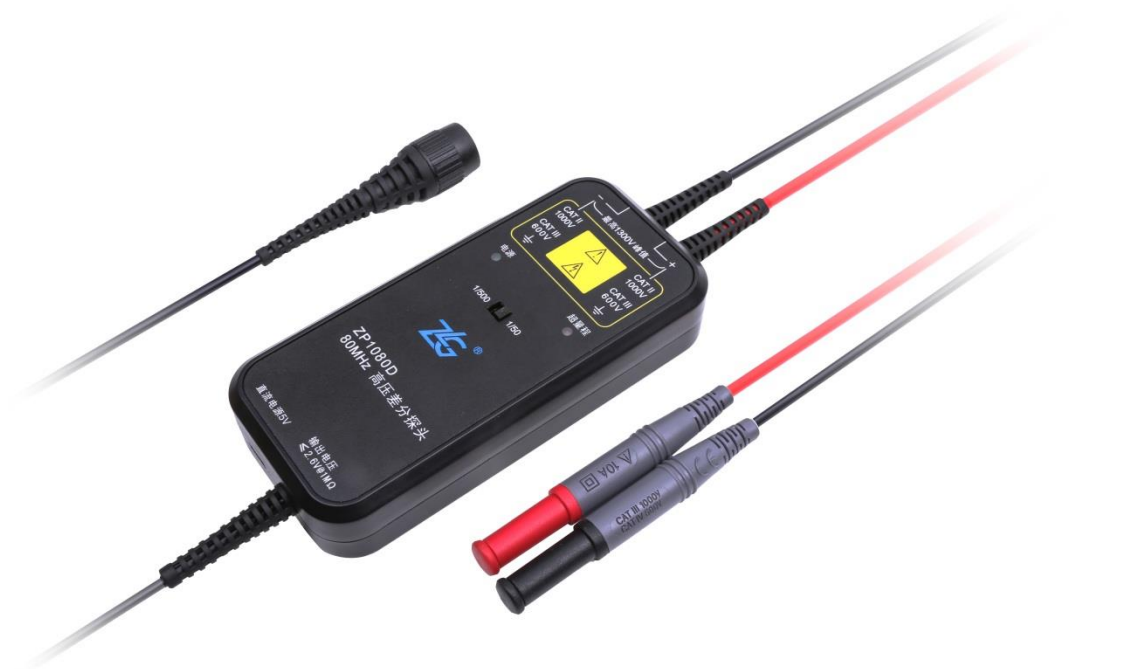
图 2 ZP1080D 探头主体