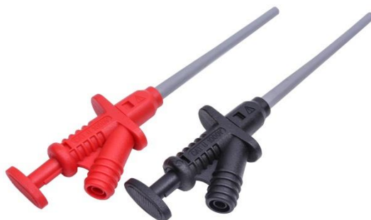
图 5 探针