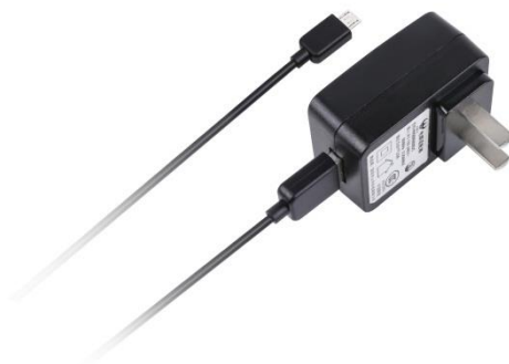
图 3 电源适配器

ZP1000 系列高压差分探头的附件包括电源适配器一只（如图 3 所示）、红黑鳄鱼夹各一只（如图 4 所示）、红黑探针各一只（如图 5 所示）。