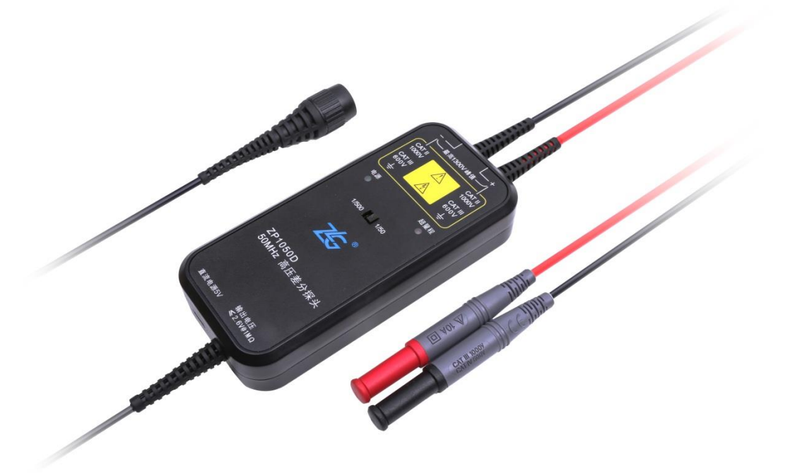
图 1 ZP1050D 探头主体