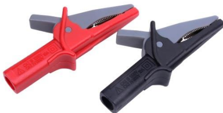
图 4 鳄鱼夹